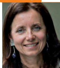
Par Gaëlle Auffret, mouette : le vol retour